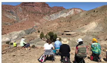
ÉTÉ 2018 Les stages